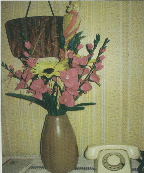
TIDSLØMME. Vi må have en autentisk lejlighed fra kommunisttiden at vise frem til turisterne, tænkte de driftige folk i guideforetagnet Crazy Guides. Sørme om de ikke også fik fremskaffet en lille toværelses i Nowa Huta. Lejlighedens interier er det samme, som før muren faldt. Men øjeren – han er udvandet. Til USA.

Radisson SAS. Det eneste hotel, vi bestilte hjemmefra, hvor vi stadig var i den vildfarelse, at hotellerne i Krakow var lousy. Radisson ved man, hvad er, tænkte vi – og blev skuffede. Et moderne businesshotel med en sær, maritim indretning på værelserne. Vodkæen i den sent åbne hotelbar fejler dog ikke noget, og morgenmadsbuffeten fås ikke bedre. Priser varierer, fra omkring 200 euro per nat for et dobbeltværelse. Adresse: Ul. Straszewskiego 17. Tlf. 00 48 12 618 88 88. www.radissonsas.com